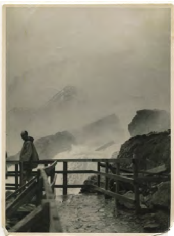
Untitled (Niagara Falls), 1937 Photograph, 11.4 x 8.4 cm Taken at Goat Island by Gustav Cramer DGC