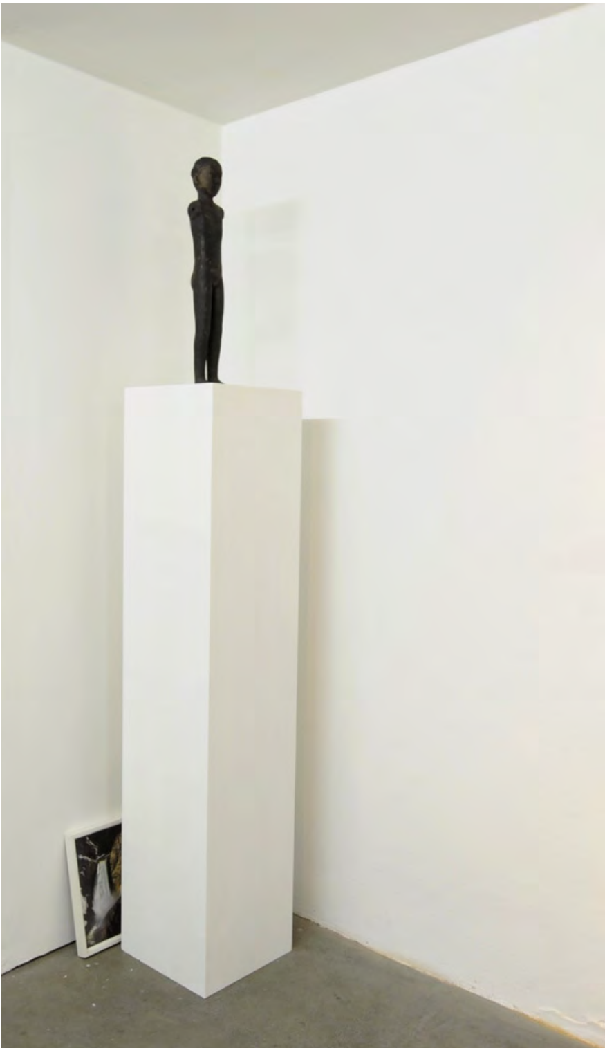
Untitled (figure, waterfall III), 2009/2010 Black Terracotta Han Figure 206 B.C - AD 220 plinth, framed found image HE