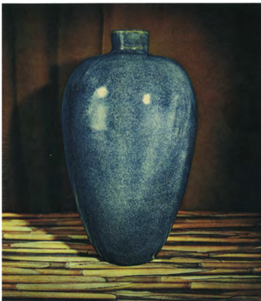
Untitled #03 k/g, 2008 Framed found image, 36 x 32cm HE