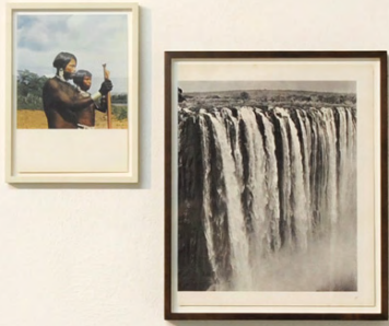
Untitled #01 t/c, 2010 Two found images framed (diptych) 23.5 x 17.5 cm & 35.5 x 29.5 cm HE