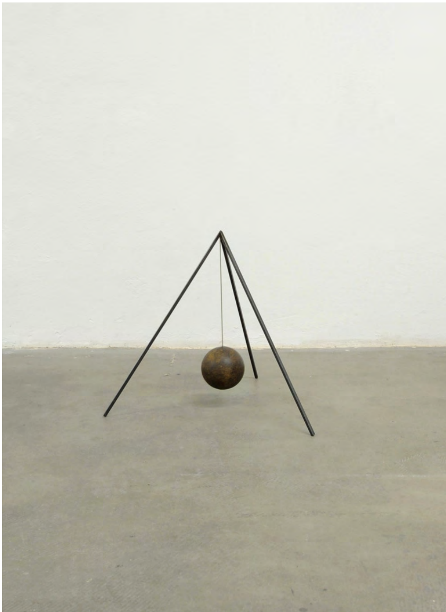
Sculpture I, 2009 Metal, iron ball, 41 x 41 x 40 cm