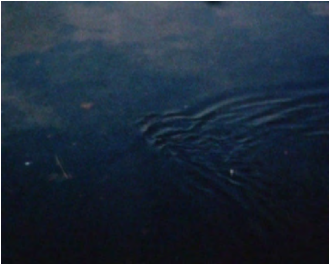
Untitled (Fish), 2008 Video on DVD, 3:54 min., sound A school of fish swimming below the surface of the water, disguised by the reflection of clouds and sky in the harbour of Kii-Katsuura, Wakayama Prefecture, Japan. DGC