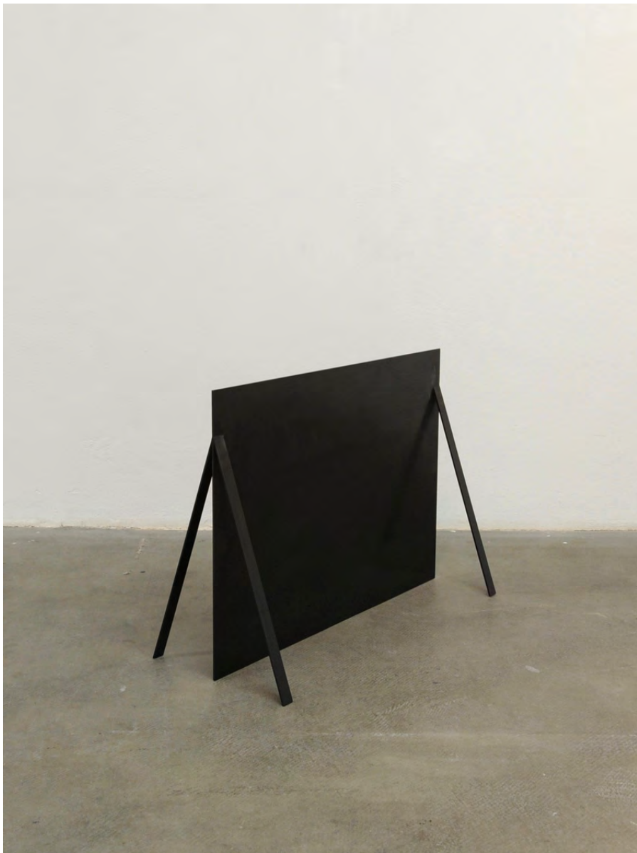
Sculpture II, 2010 Metal, 85 x 55 x 23 cm DGC