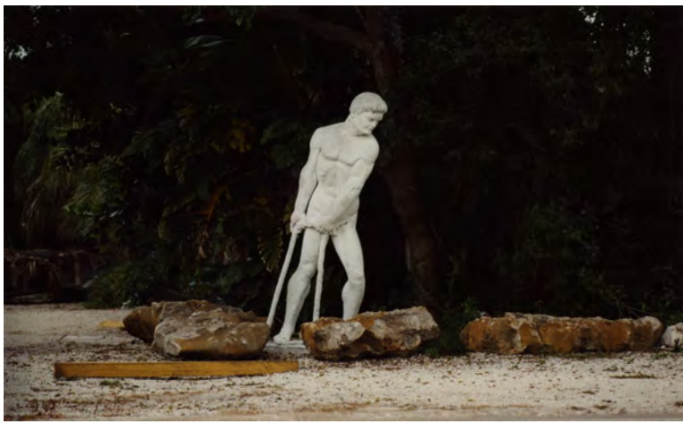
Key Largo, Florida, December 2008 C-print, 20.2 x 25.5 cm from Tales series DGC