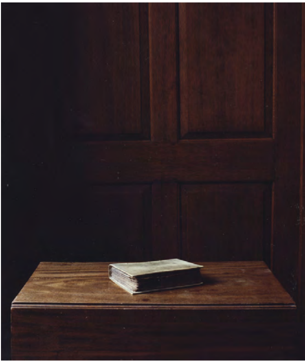
Untitled (Eusebius – Jerome), 2009 C-print, 71 x 61 cm

The oldest non-biblical Latin manuscript in Great Britain, a manuscript of St. Jerome's Latin translation and adaptation of the Greek chronicle of Eusebius, bishop of Caesarea, describing the history of mankind starting with Adam and Eve until A.D. 378, with supplements added by other writers, the final appendage in A.D. 442. The chronicle constructs a time line comparing parallel historical records from the first year of Abraham to the twentieth of Jerome's own emperor Constantine (A.D. 326), linking the Macedonian king-lists and Greek Olympiads with the regnal years of Roman emperors.