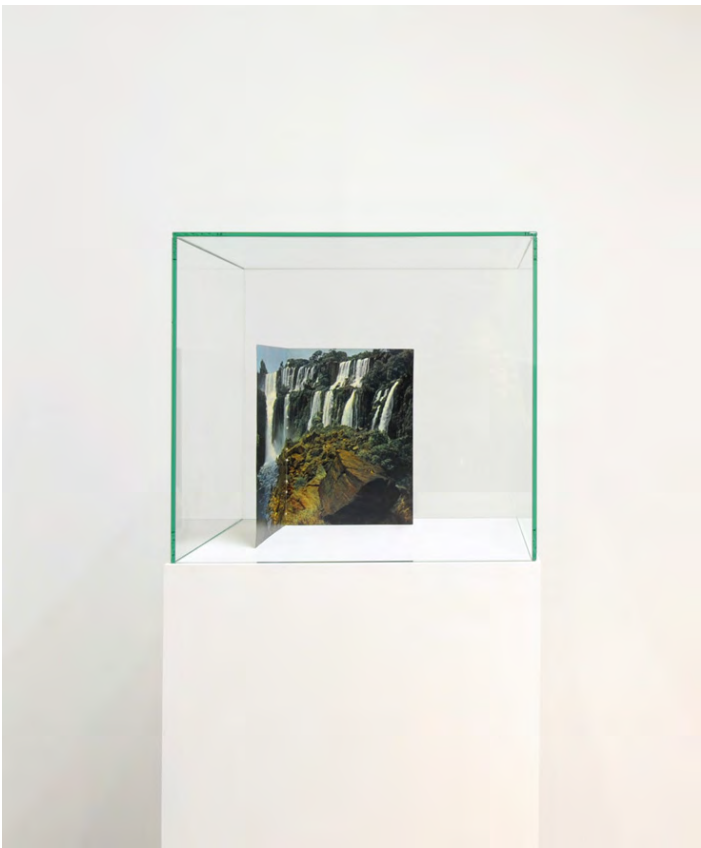
Untitled #06 m/q (waterfall II), 2009 Standing book page (one side monochrome /one side color), glass, plinth, dimensions variable HE